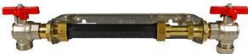
Exempel på Vattenmätarkonsol med ventiler för mätare 190-220mm

Vattenmätare tillhör VA-verksamheten. Det är endast VA-verksamhetens personal som har rätt att sätta upp, ta ner, kontrollera, underhålla vattenmätaren samt hantera servisventiler i gatan. Övriga anordningar i anslutning till mätarplatsen är fastighetsägarens egendom och ansvar.